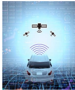
GPSによる 車両位置情報管理