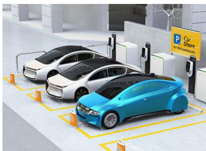
レンタカー・カーシェア